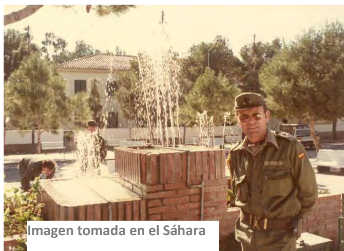
Imagen tomada en el Sáhara

Poco después se casó y fruto de su matrimonio, nacieron sus tres hijos. Una familia, que siempre le ha acompañado a todos los lugares donde ha estado destinado, ejerciendo su profesión en Olot (Girona), Hoyo de Manzanares, Cuartel de Menacho (Badajoz), Ciudad Real, Madrid y Alicante, siendo este último, su destino final, donde estuvo afincado durante 36 años.